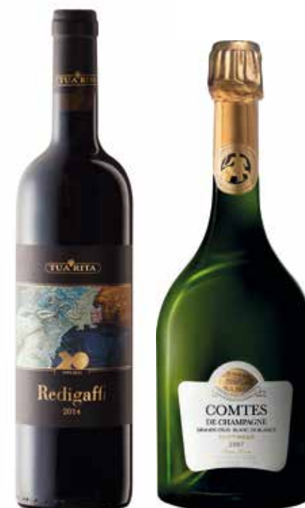
POLTRONA € 360,00 / COD 932

CASSETTA LEGNO "Love Live Gift" MESSORIO TOSCANA IGT Bolgheri "Le Macchiole" 75cl (Toscana) CHAMPAGNE COMTES de Champagne Rosé "Taittinger" 75cl (Francia)