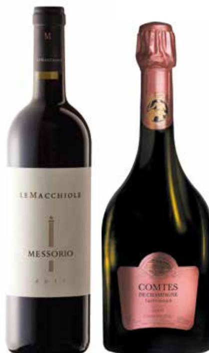
VERANDA € 360,00 / COD 931

CASSETTA LEGNO "Love Live Gift" TOSCANA BIANCO IGT Degeres "Montepepe" 75cl (Toscana) ROSSO TOSCANA IGT "Petra" 75cl (Toscana)