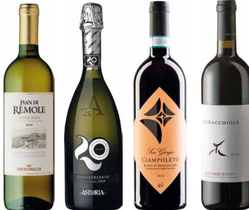
PALMA € 49,00 / COD 908

CASSETTA LEGNO "Love Live Gift" ROSSO IGT TRIPLE "A" Terre Siciliane SP68 "Occhipinti" 75cl (Sicilia) CHIANTI CLASSICO DOCG "Isole e Olena" 75cl (Toscana)