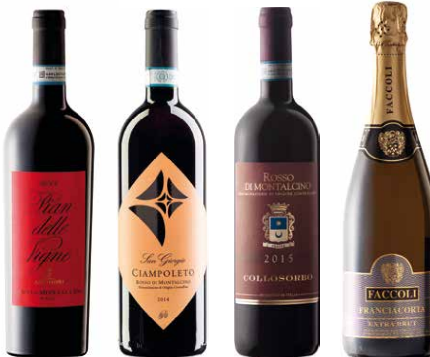
TEAK € 68,90 / COD 910

CASSETTA LEGNO "Love Live Gift" BOLGHERI ROSSO DOC "Grattamacco" 75cl (Toscana) HEBO SUVERETO DOCG Toscana "Petra" 75cl (Toscana)