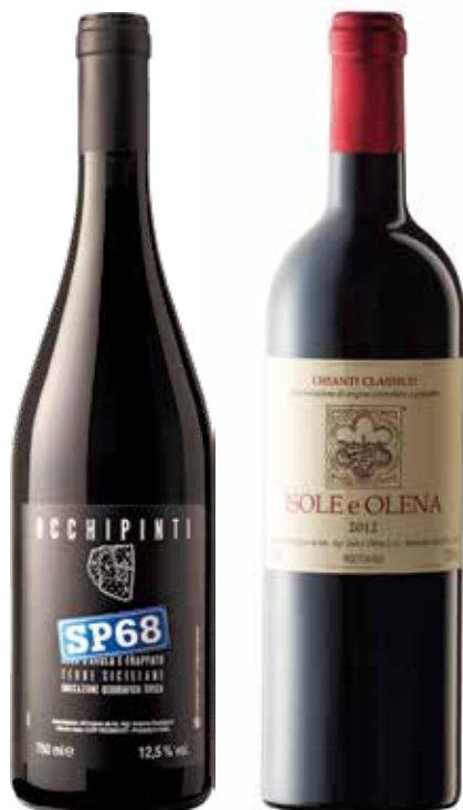
QUERCIA € 40,00 / COD 907

CASSETTA LEGNO "Love Live Gift" ROSSO IGT TRIPLE "A" Terre Siciliane SP68 "Occhipinti" 75cl (Sicilia) CHIANTI CLASSICO DOCG "Isole e Olena" 75cl (Toscana)