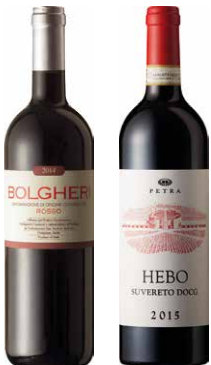
CEDRO € 34,00 / COD 909

CASSETTA LEGNO "Love Live Gift" PIAN DI REMOLE bianco IGT "Frescobaldi" 75cl (Toscana) PROSECCO CONEGLIANO Valdobbiadene DOCG Anniversario "Astoria" 75cl (Veneto) ROSSO DI MONTALCINO DOC "Ciampoletto" 75cl (Toscana) BOLGHERI ROSSO DOC "Le Macchiole" 75cl (Toscana)