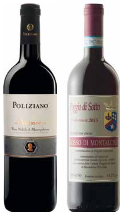
QUADRO € 98,00 / COD 928

CASSETTA LEGNO "Love Live Gift" NOBILE DI MONTEPULCIANO Asinone DOCG "Poliziano" 75cl (Toscana) ROSSO DI MONTALCINO DOC BIO "Poggio di Sotto" 75cl (Toscana)