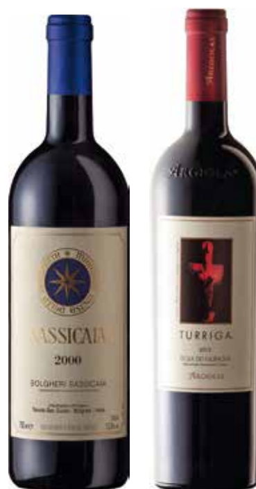
CREDENZA € 180,00 / COD 929

CASSETTA LEGNO "Love Live Gift" NOBILE DI MONTEPULCIANO Asinone DOCG "Poliziano" 75cl (Toscana) ROSSO DI MONTALCINO DOC BIO "Poggio di Sotto" 75cl (Toscana)